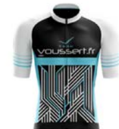
VC ELANCOURT ST-QUENTIN-YVELINES TEAMS VOUSSET