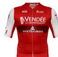
LADIES VENDEE PIVETEAU BOIS