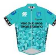
VELO CLUB ISLOIS TEAM STAMINA