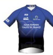
TEAM FEMININ HAUTS-DE-FRANCE