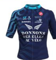
DONNON DES ELLES AU VÉLO EVRY COURCOURNÉS