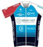
TEAM VERN 35 FEMININ