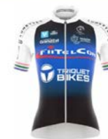
ENTENTE CYCLISTE THAONNAISE