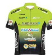
MARMANDE WOMEN DEVELOPPEMENT