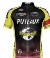
CSM PUTEAUX CYCLISME