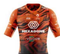
HEXAGONE - CORBAS LYON METROPOLE