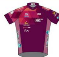
SPRINTEUR CLUB FEMININ