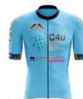
DES ROUES EN ELLES VÉLO CLUB TURIPINOIS