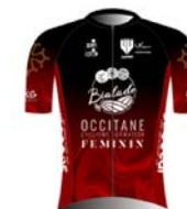
OCCITANE CYCLISME FORMATION FEMININ